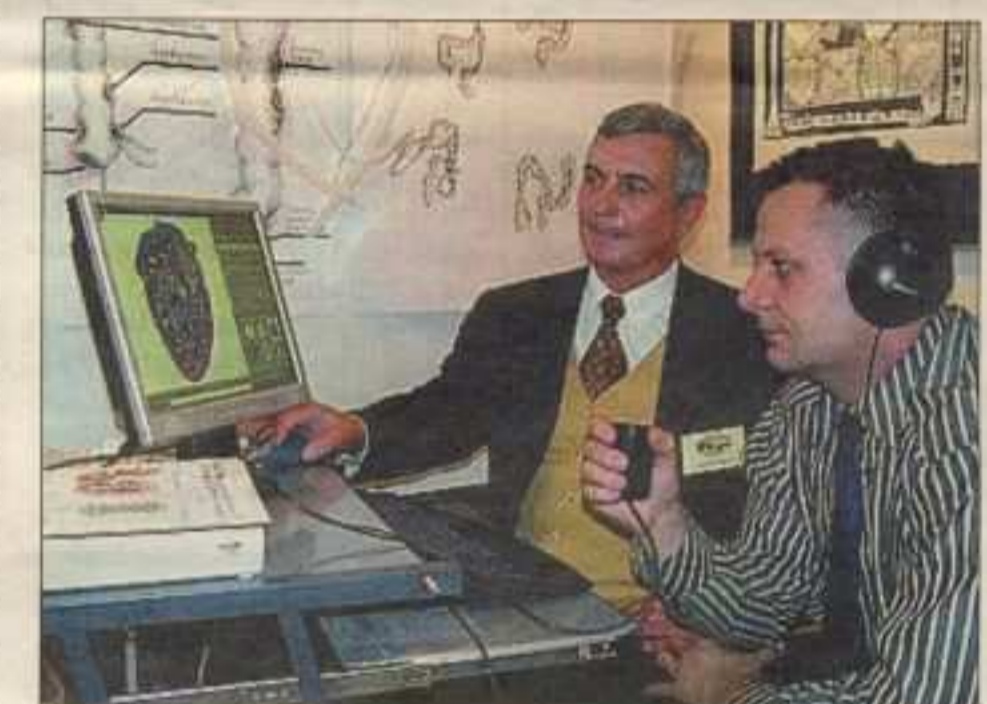
Oberon - komputer diagnozuje

CENTRUM JANA PAWLIKA znajduje się w Olsztynie, ul. Sielska 12k, tel. (0-89) 527-11-22