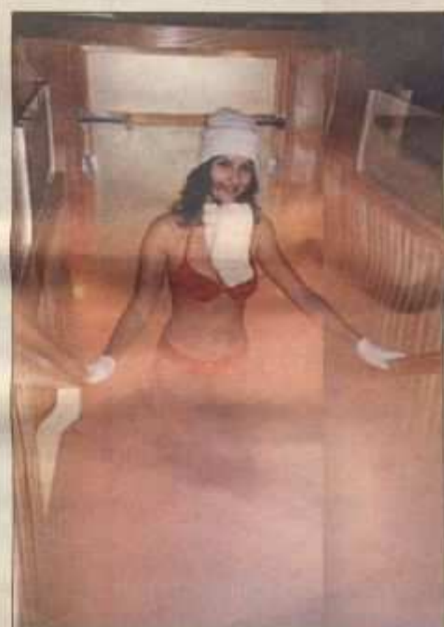
Strój do temperatury -140 st. jest skąpy

Wiele olsztyńian, a także mieszkańcy innych miast północnej Polski, trafia do