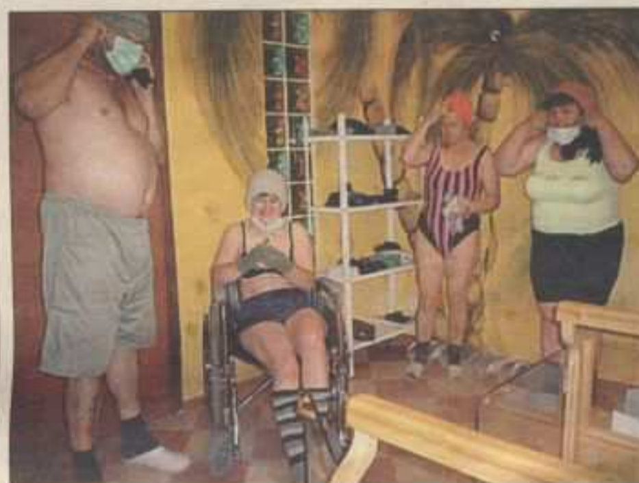
Przed wejściem do komory

sce, jak i na świecie, ze względu na jej skuteczność w leczeniu wielu chorób. W Centrum Terapii Naturalnych można skorzystać zarówno z komory zimna (-140 st. C), jak również z krioterapii