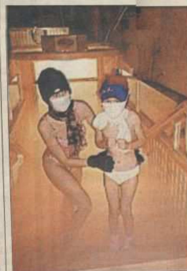
Komora dobra też dla dzieci

pięknie urządzonej komory krioterapii w Centrum Jana Pawlika. Krioterapia, czyli leczenie zimnem, zyskuje coraz większą popularność zarówno w Pol-