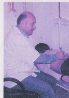
Dzięki odpowiednim testom wykrywa ok. tysiące alergenów